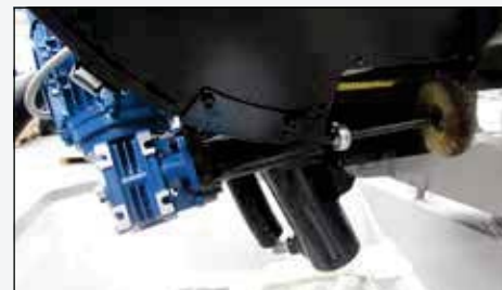
Spazzola motorizzata. Motorized brush.