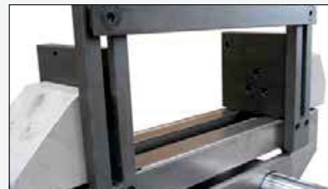
Telaio di contenimento. Frame for bar cutting.